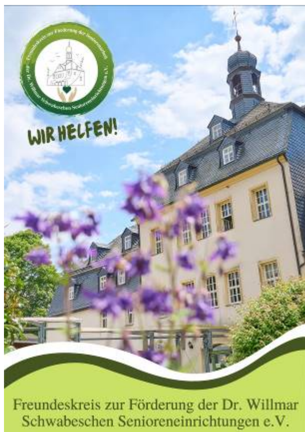
Freundeskreis zur Förderung der Dr. Willmar Schwabeschen Senioreneinrichtungen e.V.