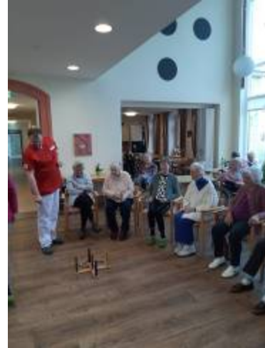
Wir waren sportlich...