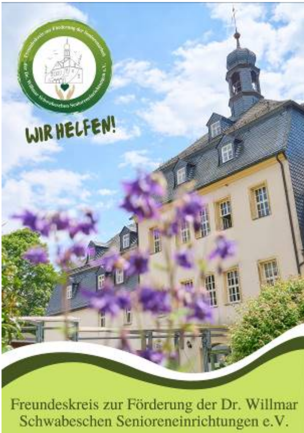
Freundeskreis zur Förderung der Dr. Willmar Schwabeschen Senioreneinrichtungen e.V.