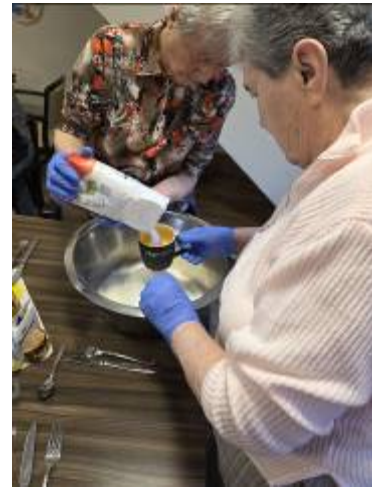
Koch- und Backgruppe, leckerer Kokos-Buttermilchkuchen...