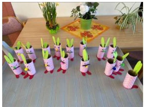
Bastelzeit... Ostern ist nicht mehr weit. Es wurde fleißig gebastelt...