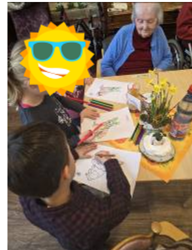
„Lebensfreude – Jung und Alt“ Besuch von den Kindern des Kinderhaus Neustädtel e. V. Wir hatten „tierischen“ Spass mit den Kindern...